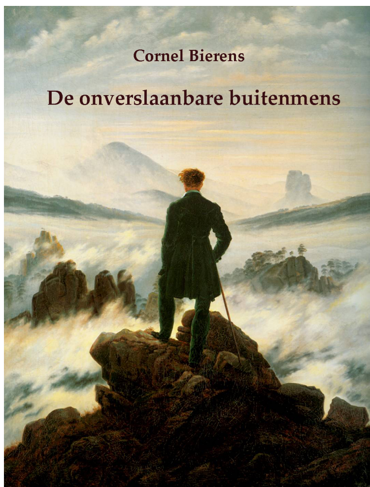
Caspar David Friedrich, Wandelaar boven de nevel, 1818