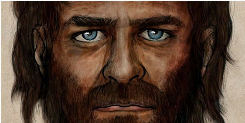
Jager-verzamelaar, Spanje, 5000 voor Chr.

U merkt, de kwelgeest in mij is al volop actief. Ik sla u om de oren met feiten die u helemaal niet wilt kennen, en waarvan u zich bovendien afvraagt of die niet op een ander symposium thuishoren. Maakt u zich geen zorgen, alles zal spoedig op z'n plaats vallen. Maar nu we eenmaal zover zijn, wilt u vast ook nog wel even weten waarom medici en farmaceuten nog steeds geen remedie hebben gevonden tegen de zwaarlijvigheid in onze luilekkerwereld. De reden is dat wij in hart en nieren buitenmensen zijn. Nog altijd zijn wij uitgerust met een genetische constellatie die we hebben opgebouwd en eindeloos geperfectioneerd gedurende de meer dan een miljoen jaar dat wij een nomadisch bestaan hebben geleid als jager-verzamelaars.